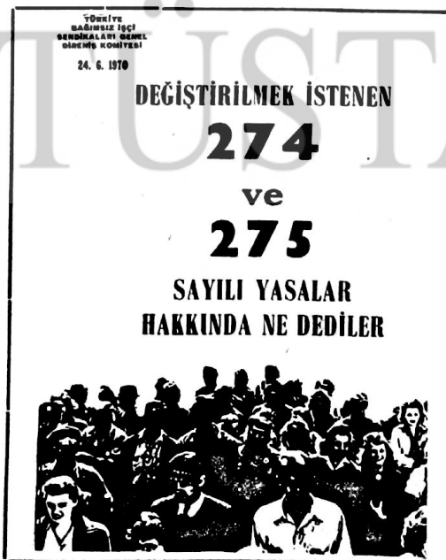
HAZIRLANAN FORUM KİTABI KAPAĞI